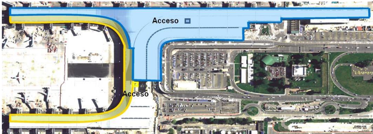
Ilustración 1. Accesos a cubierta T1