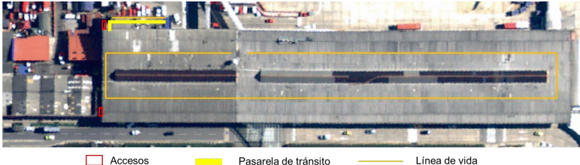
Ilustración 3. Accesos a cubierta T2