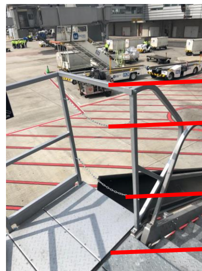
Barrera de protección