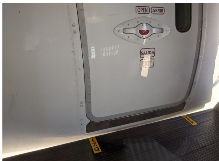
Figura 3, Visual desde cabina del puente de abordaje