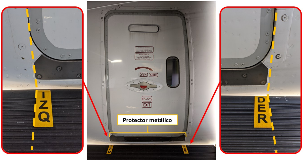
Figura 2, Señal de adose en puerta L1 de aeronave Boeing 787

Posterior a llevar el puente de abordaje a la preposición automática de la aeronave, al realizar el movimiento manual de adose, el operador del puente dirigirá el mismo hacia la puerta de la aeronave tomando como referencia la señalización IZQ (borde izquierdo) y DER (borde derecho) instalada en el piso del puente de abordaje. La parte exterior de la señal debe coincidir con la parte exterior del protector metálico de la puerta tal como se muestra en las siguientes imágenes.