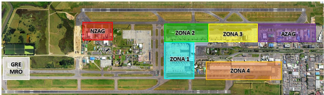
Figura 1. División por Zonas Aeropuerto Internacional el Dorado